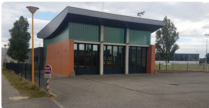
Caserne des Pompiers de La Wantzenau