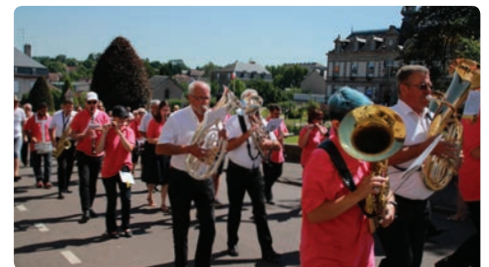
Défilé des Harmonies de Saint-Yrieix et de La Wantzenau