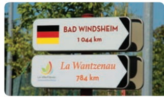
Inauguration du panneau directionnel