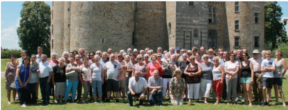
Visite du Château de Coussac-Bonneval

Pour une vingtaine de Wantzenauviens ce fut une découverte; les personnes plus habituées à se rendre en Haute-Vienne, quant à elles, étaient à la joie de retrouver leurs amis de longue date.