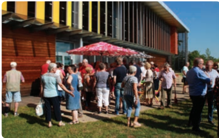
Accueil convivial et chaleureux à notre arrivée à Saint-Yrieix-la-Perche