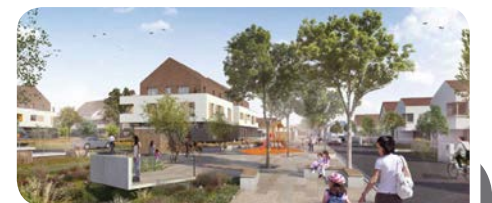
Projet Trissermatt © crédit image : K&+ ARCHITECTURE GLOBALE