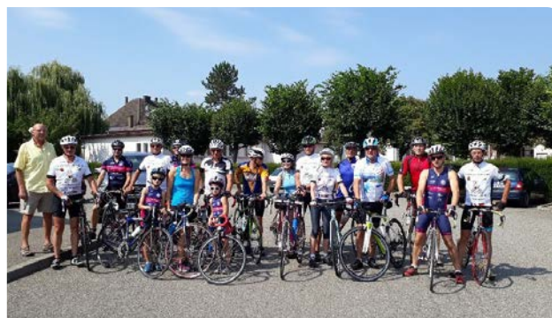
Arrivée en Alsace