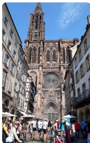
Journée de relâche