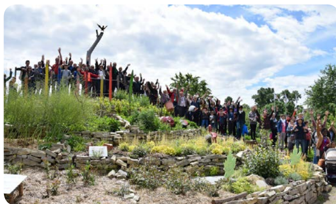
Événement de clôture 2017 Jardin des Deux Rives à Strasbourg